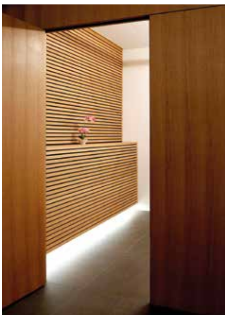
Zwischentrennwand mit zwei Türen, Eiche furniert, geölt

Wir durften etwas sehr Schönes schenken, damit der Abschied in einem stilvollen Raum und einer angenehmen Atmosphäre abgehalten werden darf.