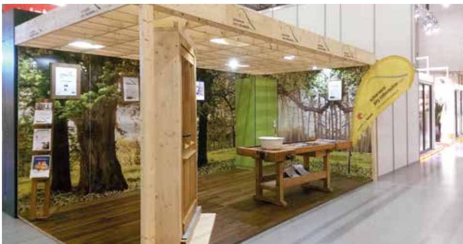
Unser Stand an der letztjährigen Bau + Energie Messe

Donnerstag / Freitag: 10–18 Uhr Samstag / Sonntag: 10–17 Uhr